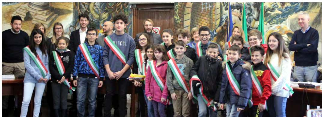
• I giovani del Consiglio Comunale dei Ragazzi con alle spalle i membri del Consiglio Comunale ufficiale.

« AL DI LÀ DELLA comprensibile delusione dei non