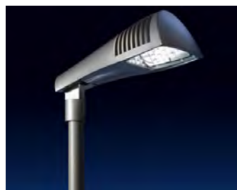
• I lampioni tradizionali saranno sostituiti dai nuovi punti luce LED.

ne di tutti i lampioni di Zibido San Giacomo coi più moderni LED è un'operazione di riqualificazione energetica che intendiamo avviare», spiega l'Assessore ai Lavori Pubblici Luca Bonizzi. «Si tratta di un intervento in "project financing" che – come di consueto – in parte si autofinanzia attraverso il forte risparmio che si va' ad ottenere sostituendo i