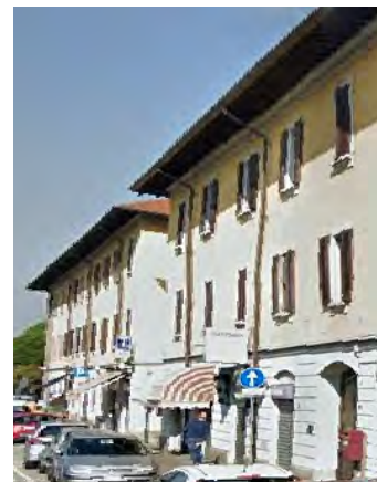
• Alcune delle case comunali che compongono il patrimonio immobiliare pubblico di proprietà del Comune di Zibido San Giacomo.

« SIAMO MOLTO soddisfatti perché investire in opere pubbliche è fondamentale per migliorare la qualità della vita della nostra comunità. Addirittura investire sulla formazione dei nostri ragazzi, quindi sul nostro futuro, è come investire due volte: ne beneficeranno i cittadini di domani ma anche noi stessi. Tant'è vero che abbiamo modificato il progetto iniziale che non prevedeva l'auditorium e la palestra. Ora questi impianti sono stati aggiunti all'elaborato e il plesso scolastico potrà diventare un vero e proprio campus didattico».