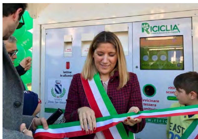
• L'inaugurazione dell'eco-compattatore “Riciclia” avvenuta giovedì 21 marzo scorso, ha richiamato moltissimi concittadini, in particolare giovani, incuriositi dalle modalità di utilizzo di questo nuovo impianto che eroga buoni sconto per i negozi.