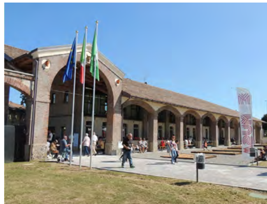
• Una immagine ufficiale del MUSA tratta dal sito internet del polo museale.

Belloli: «Il MUSA è un luogo di interesse che non può più gravare sul Bilancio»