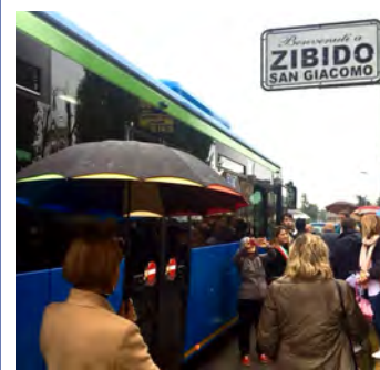
• Il Comune conferma gli investimenti sul settore dei trasporti: vedere a pagina 12.

Bilancio Previsionale: segue alle pagine seguenti