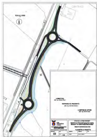
• L'atteso sistema di rotatorie alla base del ponte tronco che metteranno in sicurezza gli innesti sulla Strada Provinciale 35 dei Giovi.

RIMANGONO inoltre confermati i lavori per le