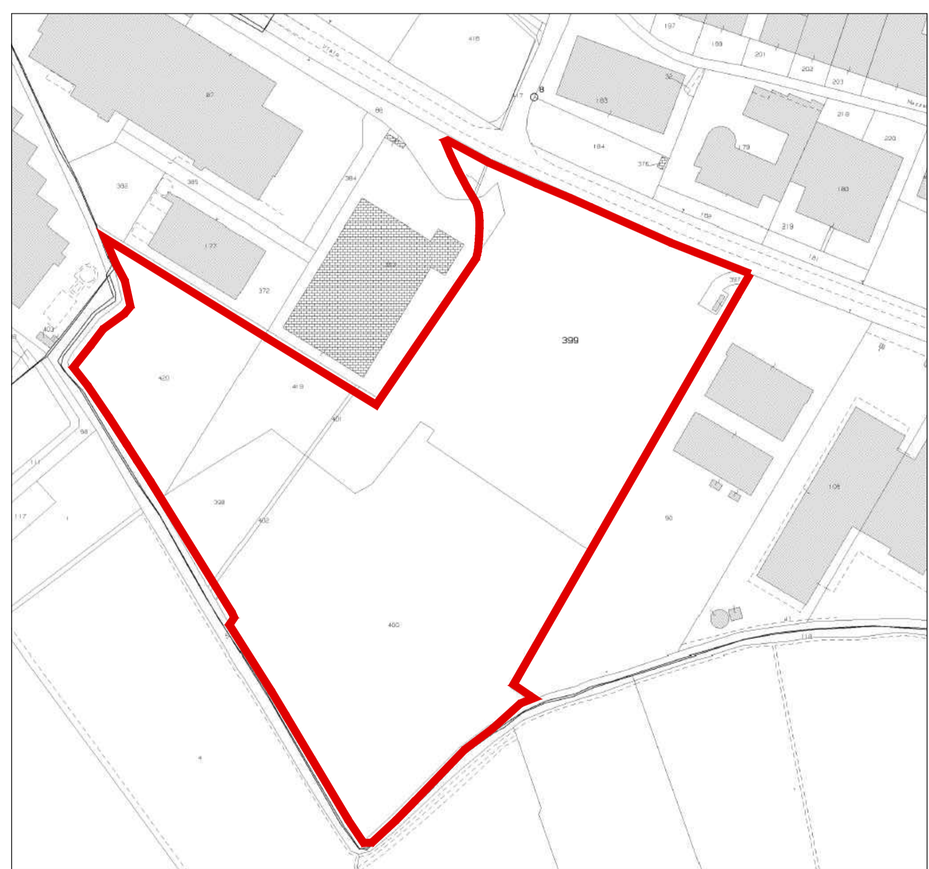
Planimetria con sovrapposizione mappa catastale PRE INTERVENTO - Scala 1:2000