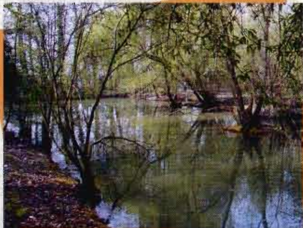
Uno degli stagni presso Cava Sannovo dove verrà reintrodotta la testuggine palustre

Per elaborare un efficace piano di azione a favore della testuggine nel territorio del Parco, sono stati intrapresi inizialmente studi approfonditi che hanno consentito di operare scelte strategiche tali da condurre alla riuscita del progetto. Ci si deve domandare, anzitutto, se si tratta di una vera reintroduzione ovvero di un potenziamento, cioè di un ripopolamento faunistico inteso ad arricchire il patrimonio genetico di una popolazione ridotta al di sotto della soglia minima vitale. La risposta a questa domanda implica una comprensione almeno sommaria della complessa dinamica di interscambio dei piccoli nuclei residui di una popolazione di testuggini d'acqua all'interno di una realtà qual è quella della bassa pianura lombarda di oggi. Dovrebbe trattarsi, infatti, di una metapopolazione costituita da diversi nuclei relativamente isolati tra loro ma