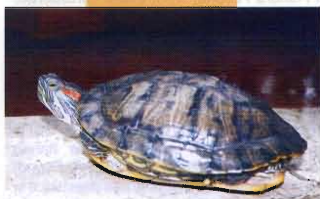
Testuggine americana ( Trachemys scripta , Schoepf 1792)

necessitano di acque meno profonde, le femmine prima di deporre si spostano in aree diverse, i neonati necessitano assolutamente di acque completamente ferme (pena l'annegamento).