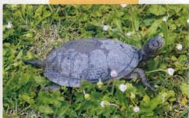
Testuggine palustre ( Emys orbicularis , Linnaeus 1758)