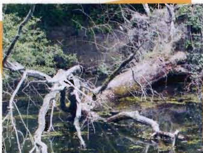
Tipico ambiente occupato dalla testuggine palustre nel Delta del Po

Altre caratteristiche ambientali che nel corso di questo studio sono apparse significative per