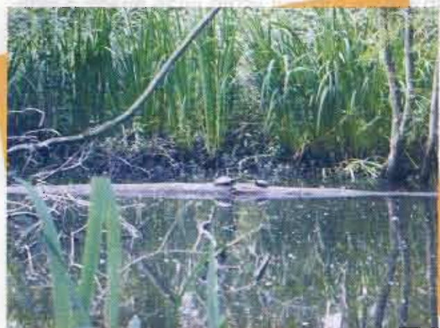
Testuggine palustre nel Delta del Po

La testuggine palustre europea è una specie a distribuzione paleartica occidentale. In Nord Italia Emys orbicularis vive solo in ambienti planiziali. La specie è attiva da marzo-aprile fino ad ottobre.