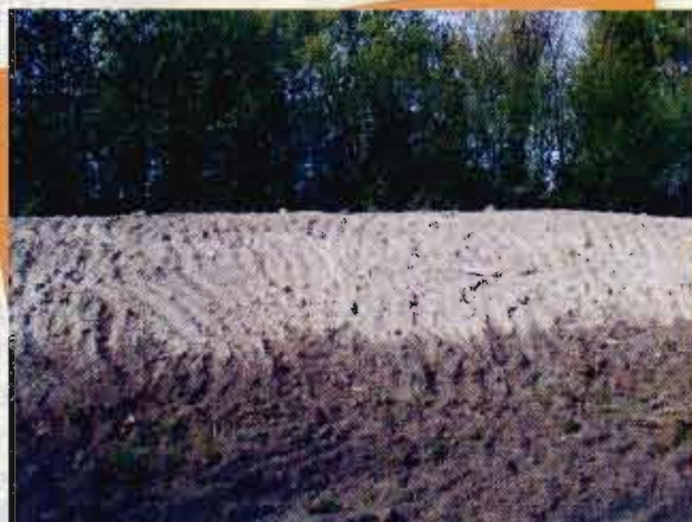
Duna artificiale creata per favorire la deposizione

durante la stagione invernale 2003/2004;