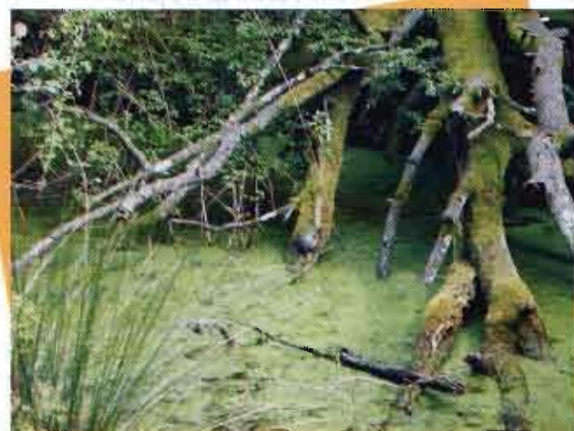
Testuggine palustre nel Delta del Po

acqua che possono fungere da punti di termoregolazione e la presenza di scarsa vegetazione galleggiante.